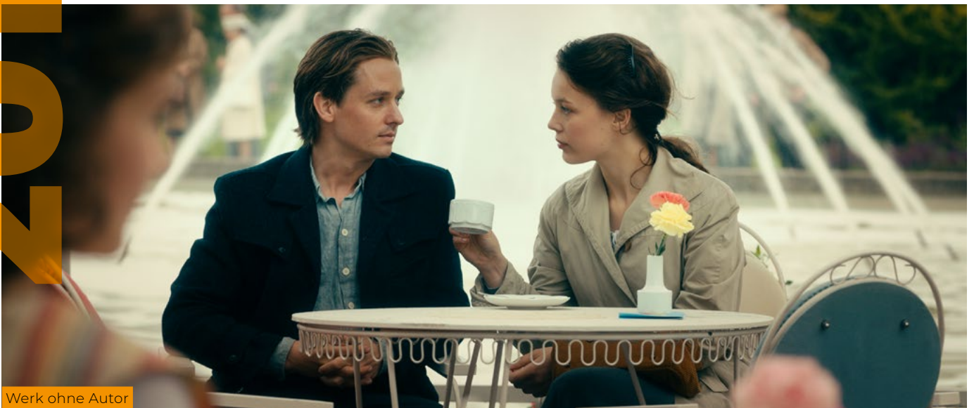
Werk ohne Autor