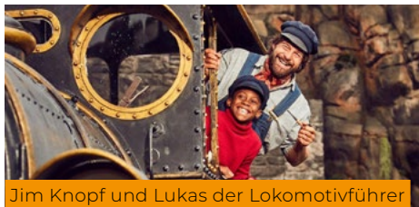
Jim Knopf und Lukas der Lokomotivführer

6 MBB- GEFÖRDERTE FILME IN DEUTSCHER TOP 10