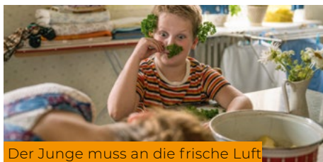
Der Junge muss an die frische Luft