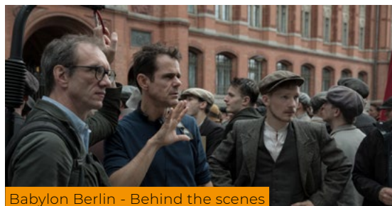
Babylon Berlin - Behind the scenes