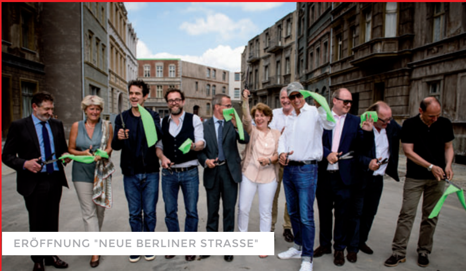
ERÖFFNUNG "NEUE BERLINER STRASSE"