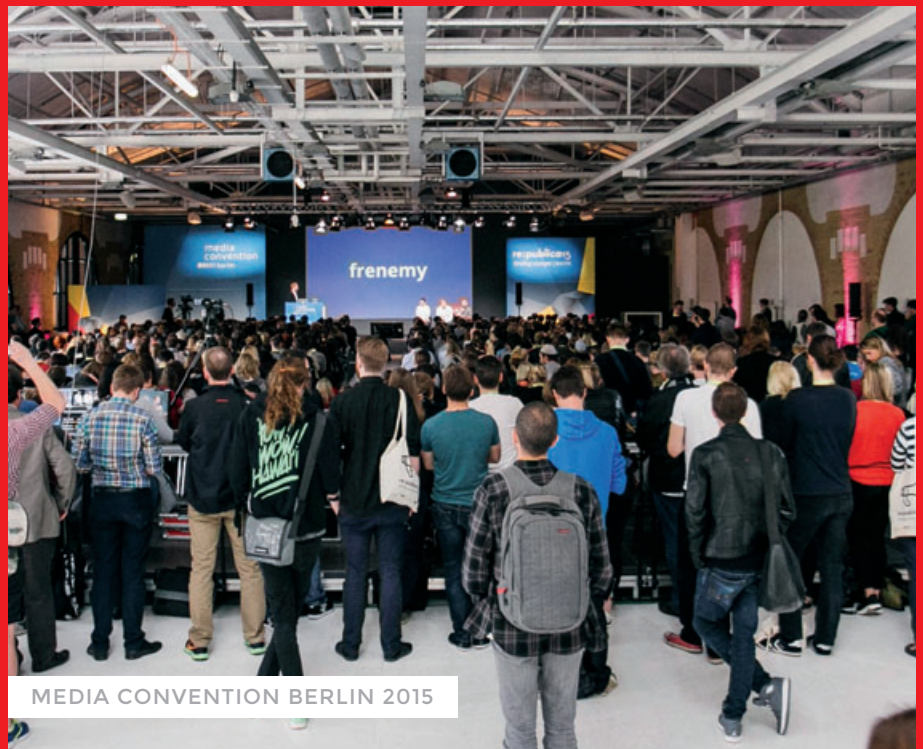
MEDIA CONVENTION BERLIN 2015

Das Medienboard fördert und veranstaltet Leuchtturmevents in der Hauptstadtregion. Hierzu zählen der Deutsche Filmpreis, der Deutsche Computerspielpreis oder der Medienboard-Empfang zur Berlinale. 2015 haben wir rund 100 Events veranstaltet, initiiert, beraten und unterstützt, davon 56 Standortprojekte mit 3,4 Mio. Euro gefördert. Mit der MEDIA CONVENTION Berlin richten wir selbst einen der größten Medienkongresse Europas aus. 7.000 Besucher in 2015, 8.000 in 2016 – so viele wie noch nie – kamen zur Doppelkonferenz MCB und re:publica und informierten sich zu Themen wie Netzneutralität, Journalismus, Videomarkt oder Virtual Reality.