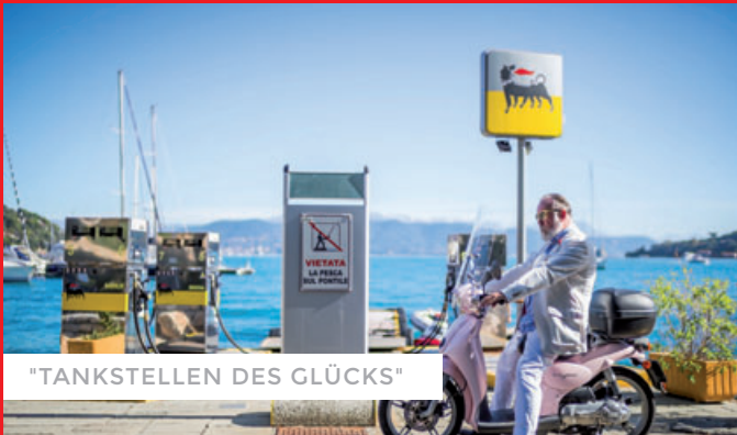
"TANKSTELLEN DES GLÜCKS"