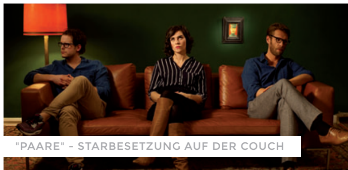
"PAARE" - STARBESETZUNG AUF DER COUCH