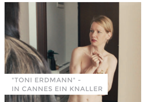
"TONI ERDMANN" - IN CANNES EIN KNALLER