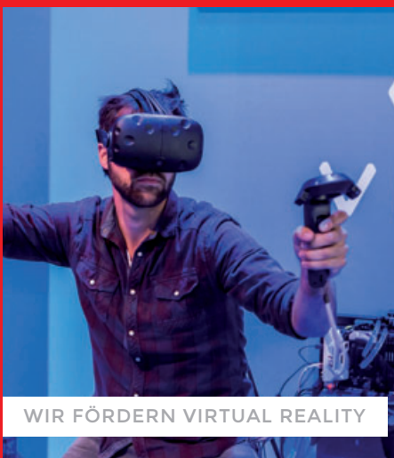
WIR FÖRDERN VIRTUAL REALITY

Die Stimmung unter den Medienmachern der audiovisuellen Branche ist hervorragend, die Erwartungen sind positiv, die Unternehmen wollen Personal einstellen. Daran arbeitet das Medienboard seit über 10 Jahren durch Förderung, Standortentwicklung und internationales Marketing höchst erfolgreich mit. 2015 wurden insgesamt 309 Projekte aus den Bereichen Filmförderung und Standortentwicklung mit rund 30,4 Mio. Euro gefördert. Dadurch wurden Ausgaben in Höhe von mehr als 135 Mio. Euro ausgelöst!