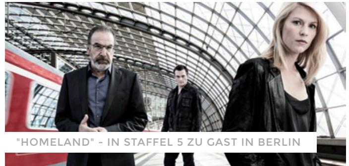
"HOMELAND" - IN STAFFEL 5 ZU GAST IN BERLIN

Das Medienboard hat 2015 serielle Formate als eigenes Förderprogramm in sein umfangreiches Portfolio aufgenommen und unterstützt damit als eine der ersten deutschen Fördereinrichtungen die Entwicklung und Produktion serieller TV-Formate im HighEnd-Bereich. Mit der 5. Staffel der Erfolgsserie "Homeland" ging es gleich bombastisch los. Das zog weitere internationale Seriendreh nach sich, "Berlin Station" und "Sense8" zum Beispiel. Gedreht werden 2016 3 deutsche Serienstoffe: "Babylon Berlin", der gigantische 20er-Jahre-Krimi-Mehrteiler, "4 Blocks" und die erste deutsche Amazon-Serie "You Are Wanted".