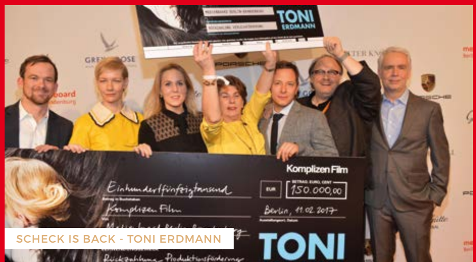
SCHECK IS BACK - TONI ERDMANN