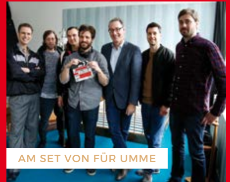
AM SET VON FÜR UMME