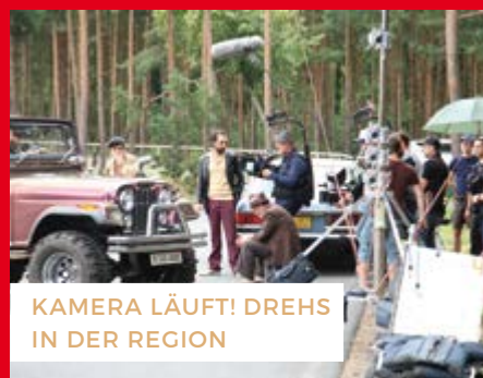
KAMERA LÄUFT! DREHS IN DER REGION