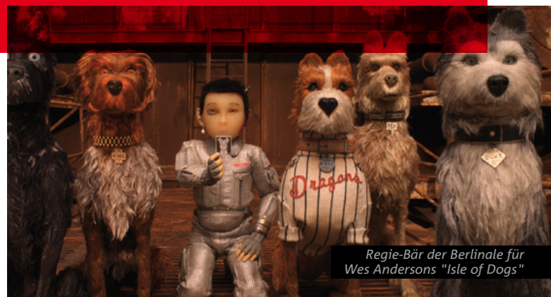
Regie-Bär der Berlinale für Wes Andersons "Isle of Dogs"

Außerdem haben sie in dieser Zeit über 250 Mio. Zuschauer*innen allein in Deutschland in die Kinos gelockt! Film ist also nicht nur schön, sondern bringt auch Umsatz.