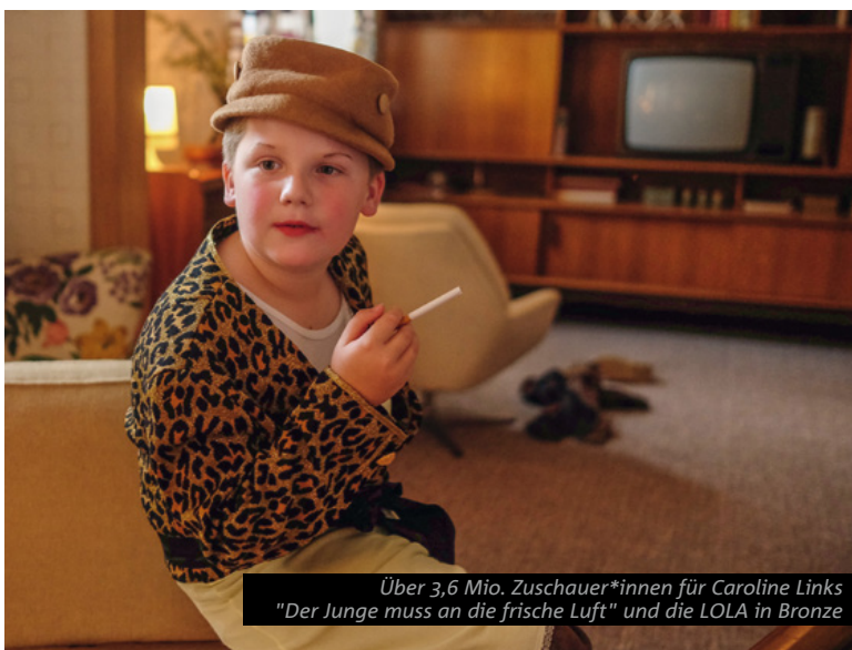
Über 3,6 Mio. Zuschauer*innen für Caroline Links "Der Junge muss an die frische Luft" und die LOLA in Bronze

Die geförderten Filmproduktionen haben insgesamt 1,6 Mrd. Euro und damit mehr als das 4-Fache des Förderbetrags in der Region ausgegeben.