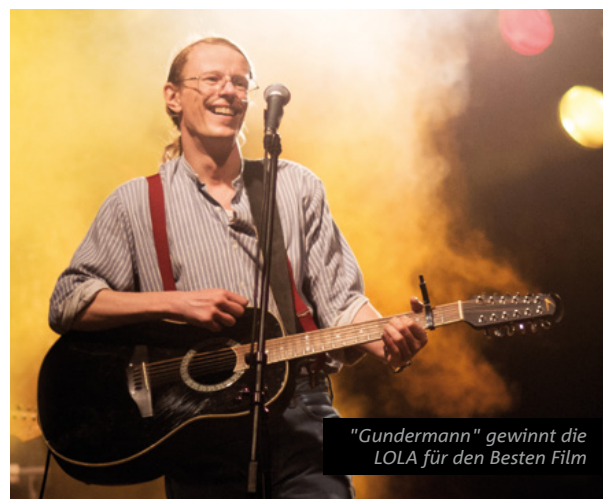
"Gundermann" gewinnt die LOLA für den Besten Film